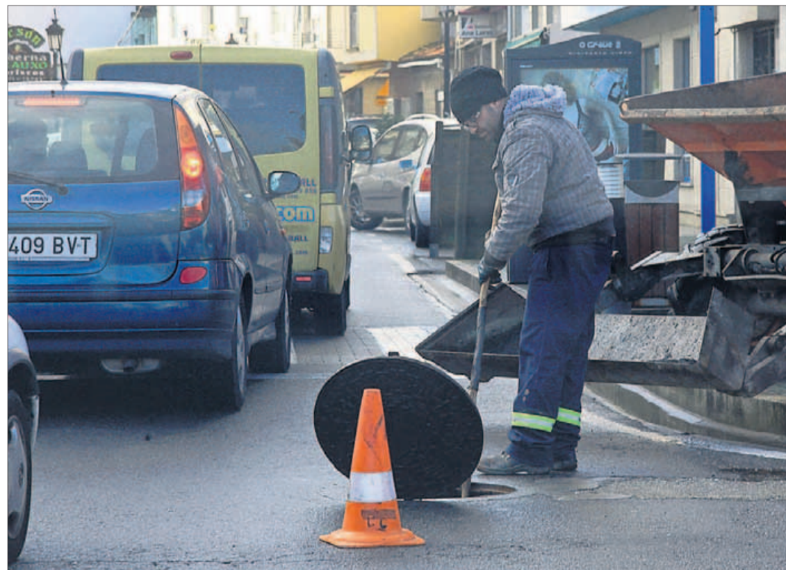
Trabajos de limpieza del alcantarillado en el centro urbano de la localidad.

En cualquier caso, en el Concello apelan a la colaboración de los ciudadanos y les solicitan que no viertan a la red de alcantarillado objetos o productos que puedan atascarlo.